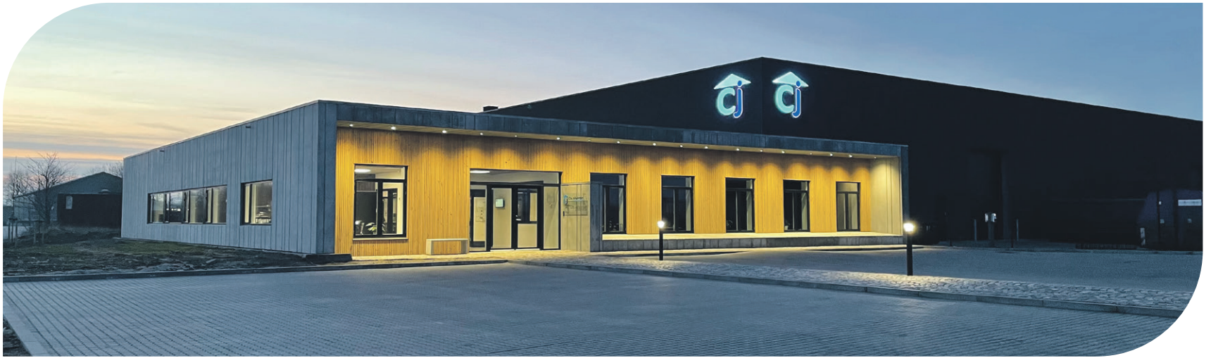
Nye miljøstandarder finder vej til byggeriet i disse år. Det nye domicil genbruger bla. regnvand.